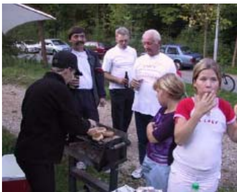
Hygge i skoven ved grillen....