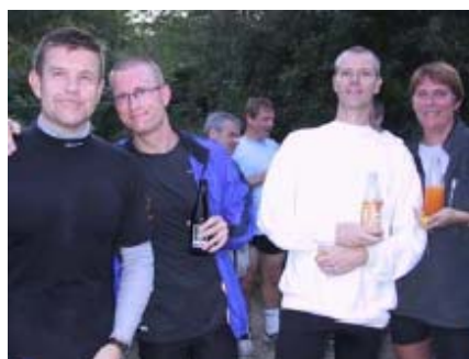
med øl og vand mm.....